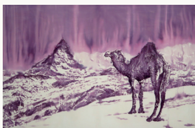
SWISS PYRAMID 2019 INK ON CANVAS 190x280 cm