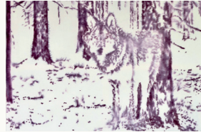
WILD 2017 INK ON CANVAS 170x140 cm