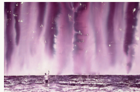
SELFIE 2018 INK ON CANVAS 150x200 cm