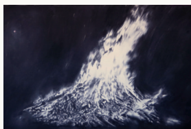
VENUS 2011 INK ON CANVAS 140x300 cm