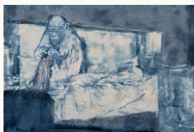
LOST 2009 INK ON CANVAS 80x100 cm