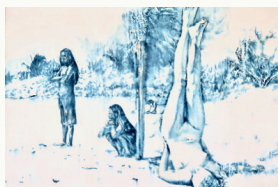
TULUM 2005 INK ON CANVAS 130x185 cm