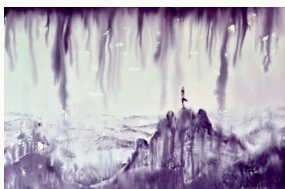
TREE 2018 INK ON CANVAS 140x260 cm