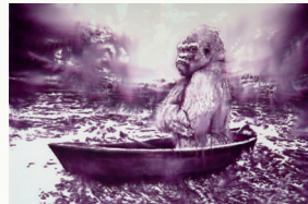
THE LAST ONE 2017 INK ON CANVAS 150x200 cm